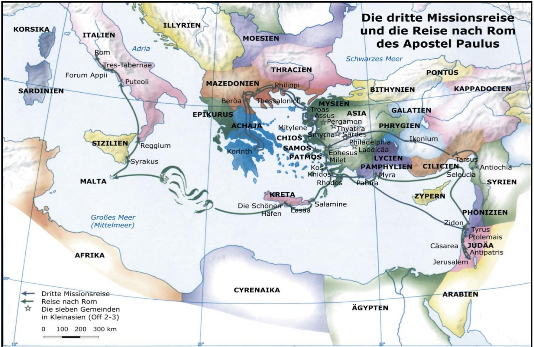
Dritte zweite Missionsreise des Apostels Paulus und Reise nach Rom